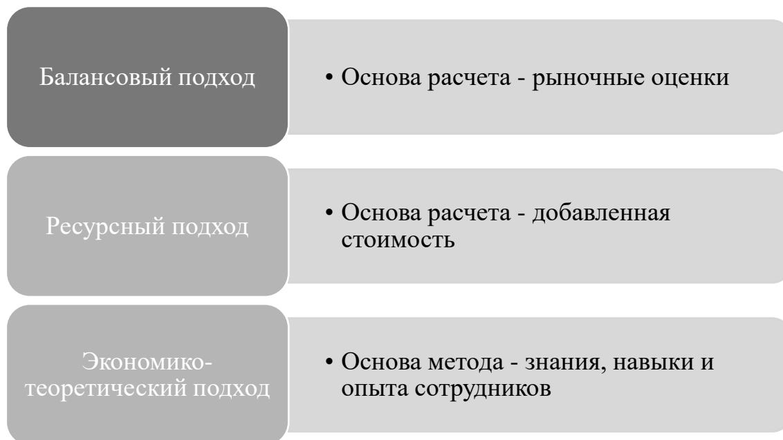
Рисунок 2 – Подходы к оценке интеллектуального капитала

Балансовый подход основывается на расчете разницы между рыночной и балансовой стоимостью предприятия. Для проведения расчетов в рамках данного подхода выделяют ряд методов. (Рисунок 3)