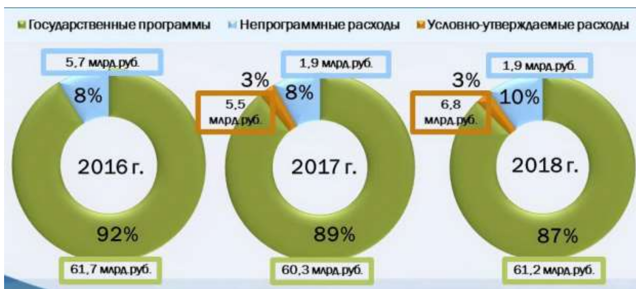
Рис. 3. Финансирование федеральных целевых программ, млрд руб. 3

Рассмотрим основные государственные целевые программы.